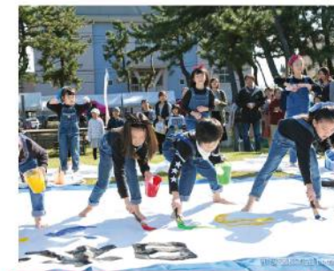
書道パフォーマンス(筆っ子隊)

■時間 ①12:25～ ②13:35～ ※各15分程度 ■場所 大町5丁目通り(歩行者天国)