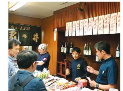
越後・謙信SAKEまつりイベント

1,000円チケットをご購入頂き、上越・妙高の地酒をお楽しみ頂けます。各蔵元のこだわり銘酒を飲み比べるチャンス!